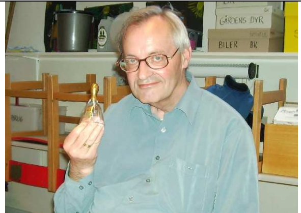
Formanden anviser, hvordan dirigentklokken bruges